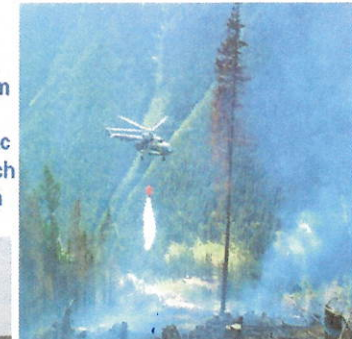
hasenie lesných požiarov patrí medzi najnáročnejšie zásahy hasičských jednotiek

Plní úlohy súvisiace so zdolávaním požiarov, s poskytovaním pomoci a s vykonávaním záchranných prác pri haváriách, živelných pohromách a iných mimoriadnych udalostiach