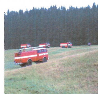
zabezpečuje dostatok hasiacej látky