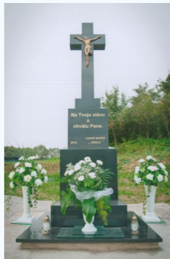
Križ bol postavený z obetavosti veriacich členov Lesného spoločenstva Jedle na chválu a slávu Božiu. Bol posvätený 14.9.2010 na sviatok Povýšenia križa.

K nám sv. Mikuláš, ktorého sme dlho očakávali a na ktorého sme sa tak veľmi tešili, zavítal v nedeľu 5. decembra 2010 o 15:00 hod. Prišiel navštíviť naše deti do sály kultúrneho domu, ktoré si pre neho pripravili krásne predvianočné vystúpenie. Sv. Mikuláš si vypočul v podaní detí zo Základnej školy s materskou školou modlitbičky, básne i pesničky a veru bol veľmi šťastný, že ho detičky tak krásne v našej obci privítali a čo všetko si pre neho pripravili. A keďže sa Mikulášovi vystúpenie detí tak veľmi páčilo, obdaroval všetky deti, ktoré sa tohto krásneho mikulášskeho posedenia zúčastnili sladkými balíčkami. Tie mu na oplátku krásne zarecitovali alebo zaspievali. Poniektorí si na tento krásny deň chceli ponechať spomienku a tak sa s Mikulášom aj odfotili. Na záver sa Mikuláš so všetkými malými i veľkými rozlúčil, ešte raz poďakoval za krásne privítanie a prisľúbil, že o rok k nám určite zasavíta.